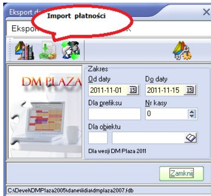
Ilustracja 1: Okno główne modułu importu

Import płatności do DM Plaza dodana jest do modułu komunikacji z systemem FK. Aby z niej skorzystać należy przycisnąć przycisk „Import płatności”